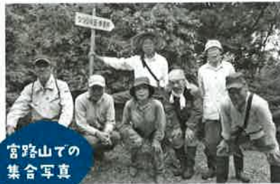
宮路山での 集合写真