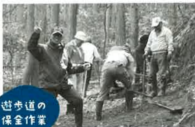
遊歩道の 保全作業